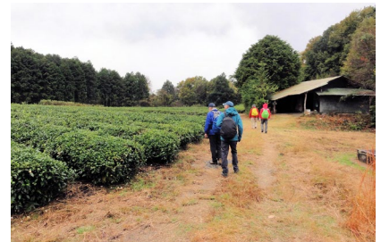
[ 2023/11/17 岐阜県御嵩町の 広大な茶畑を歩く参加者 ]

皆さん、まだまだ若いつもりでも、身動きがにぶくなってはいませんか？ 67会では、気ままな「旧街道歩き旅」を実施しています。すでに東海道、下街道、善光寺街道、名古屋から江戸までの中山道を1000km以上も歩いて来ています。この春からは、美濃太田、岐阜加納、大垣の宿場を巡って近江の国まで散策します。この機会に健康増進と名勝探訪の両方を兼ねた旧街道ウォーキングに是非ともご参加ください (希望者は青山まで一報を)。