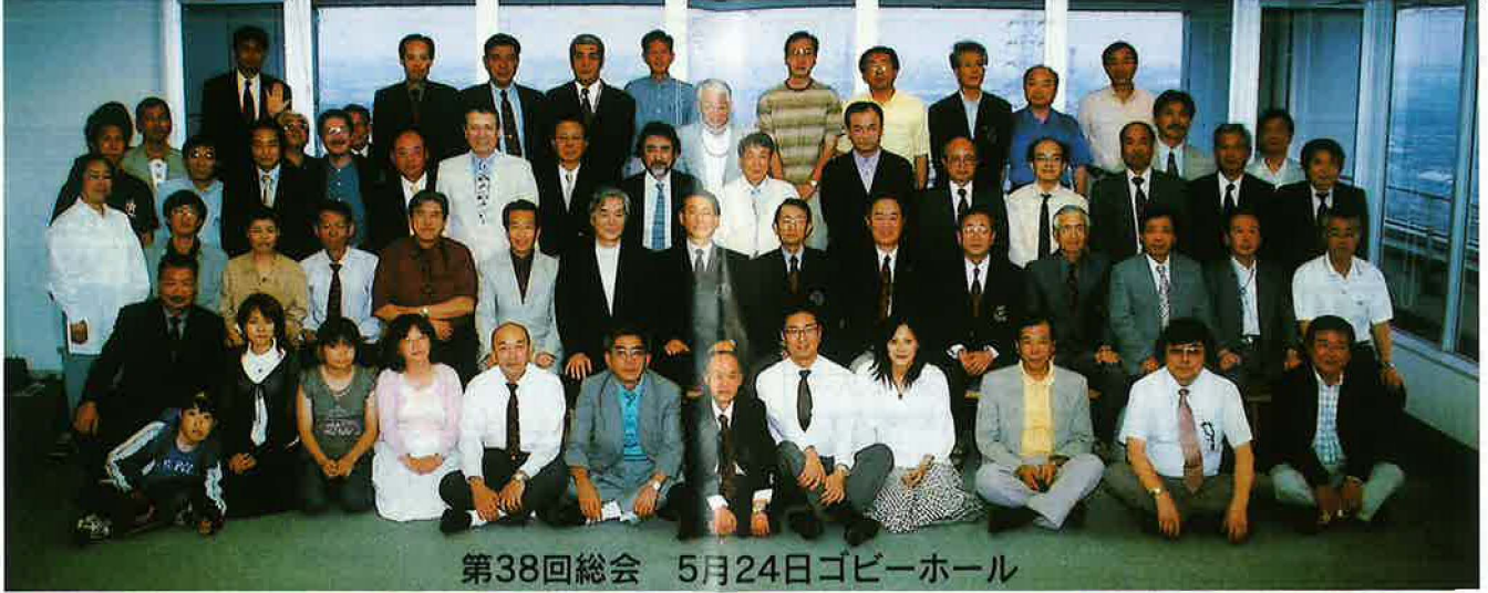
第38回総会 5月24日ゴビーホール