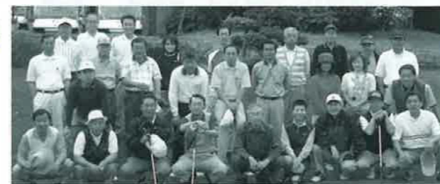
(平成15年度教職員との親睦ゴルフ模様)

あいち支部は大学のお膝元の支部です。地元名古屋の卒業生の皆さん、是非いろんなイベントにご参加賜りますようお願い致します。お待ちしております。