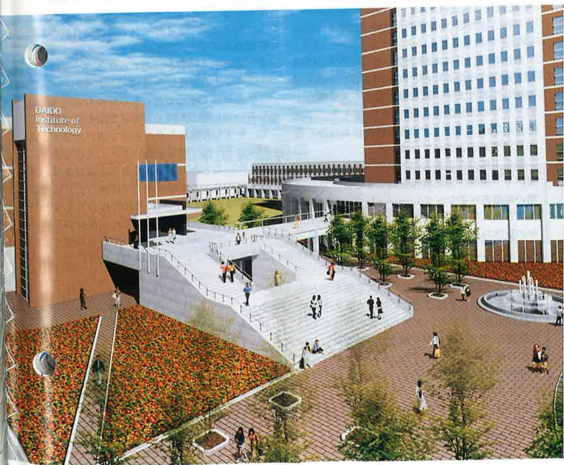
大同工業大学 新キャンパス イメージパース